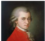
Wolfgang Amadeus Mozart (1756-1791)

Comptant parmi les plus grands compositeurs du XIX e siècle, par l'importance et la qualité de son répertoire, son nom se rattache surtout à l'opéra. Bon vivant il serait, selon certains, le père du tournedos Rossini !