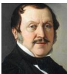
Gioacchino Antonio Rossini (1792-1868)

Comptant parmi les plus grands compositeurs du XIX e siècle, par l'importance et la qualité de son répertoire, son nom se rattache surtout à l'opéra. Bon vivant il serait, selon certains, le père du tournedos Rossini !